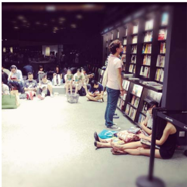
上图：希慎广场的空中花园是铜锣湾少有的开阔公共空间。 下图：深夜的书店展演区，看书客们席地而坐。